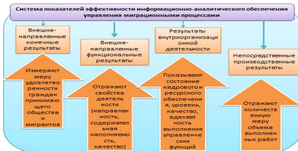
Рисунок 2 – «Дерево» показателей эффективности информационно-аналитического обеспечения в управленческой деятельности миграционной сферы

Предложенный выше подход к рассмотрению назначения и результатов информационно-аналитической деятельности может служить основанием для формирования системы («дерева») показателей эффективности ее организации и функционирования (рис.2).