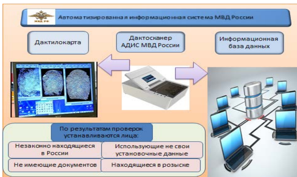
Рисунок 1 – Схема АИС МВД России

Вторая институциональная (организационная) составляющая включает органы (информационные подразделения, центры), осуществляющие информационно-аналитическое обеспечение управления миграционными процессами. Субъектами этой деятельности выступают: аналитические подразделения, местные органы, подразделения документальных проверок. Важнейшими задачами информационно-аналитических подразделений являются: осуществление комплексного анализа миграционной обстановки в субъекте РФ, тенденций развития преступности и административных правонарушений мигрантов, относящихся к сфере ведения органов государственной власти.