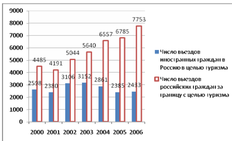
Рис. 1. Соотношение численности иностранных туристов в России и российских туристов за рубежом в 2000-2006 гг., тыс. поездок

В последние годы довольно интенсивно растет выезд российских граждан за рубеж. В 2004 г. численность выехавших за границу россиян превысило численность прибывших в страну иностранцев. А в 2006 г. эта разница составила уже 6,5 млн. поездок («в пользу россиян»). Российские граждане, выехавшие за границу, в 2006 г. примерно поровну распределяются между странами «дальнего» и «ближнего» зарубежья – 54% и 46%, соответственно.