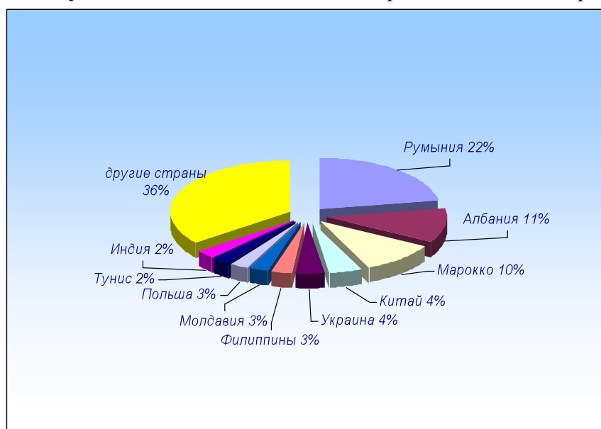
Рис. 2. 10 крупнейших иностранных общин на территории Италии на 1 января 2010 года (по странам происхождения) 32

За последние годы наиболее многочисленным стало присутствие румын в Италии, за ними следуют выходцы из Албании, Марокко, Китая и Украины.